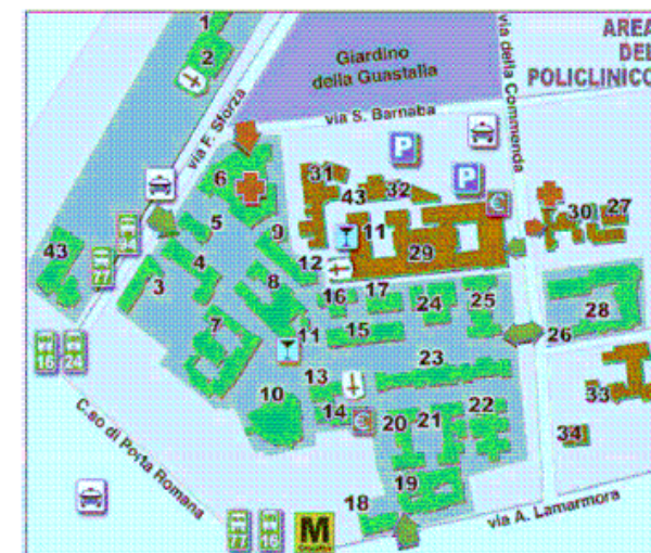
L'aula Magna-Padiglione Devoto è il numero 31.